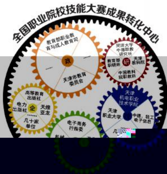
图 1 中心职能

整、“双师型”教师和综合实训基地建设导向分析;建立课程、培养规格与职业标准高效对接机制,研制开发技能大赛教学资源平台和教学仪器设备,引领和服务日常教学;创新技能人才培养选拔与教师的综合评价机制,探索学生综合职业能力培养模式;研究国赛与世界技能大赛的对接机制,引导现代教学组织方式、教学方法的广泛应用;充分发挥大赛博物馆的作用,加快大赛成果的转化,不断提高全国职业院校技能大赛的受益面。